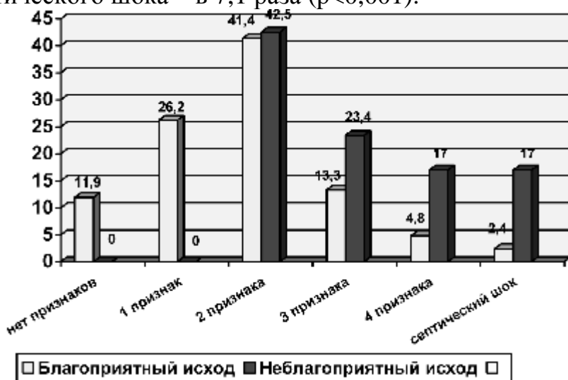
Рис. 2. Распределение больных перитонитом по группам в зависимости от количества признаков ССВО

В случаях неблагоприятного исхода резко возрастал процент больных с тремя и более признаками ССВО по отношению к группе больных с благоприятным течением заболевания [рис. 2]. Так, количество больных с 3 признаками ССВО возросло в 1,76 раза ( p < 0,05 ), с 4 признаками – в 3,54 раза ( p < 0,01 ), а в случае наличия признаков септического шока – в 7,1 раза ( p < 0,001 ).