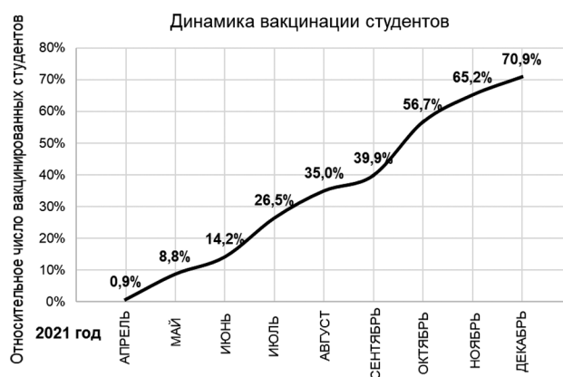
Рисунок 1. Пул вакцинированных студентов в общей выборке (динамика)

В группе невакцинированных студентов ( n = 351 , поскольку первые случаи заболевания инфекцией COVID-19 в общей выборке были зарегистрированы в апреле 2020 года, а кампания по вакцинации граждан Республики Беларусь фактически началась в марте 2021 года) переболели инфекцией COVID-19 с начала 2020 года по 31 декабря 2021 года 46,15 % (162 человека). В группе вакцинированных по состоянию на 31 декабря 2021 года студентов ( n = 249 человек) инфекцией COVID-19 после вакцинации переболели 9,24 % (23 человека). Сравнительный анализ заболеваемости в группах с применением критерия Хи-квадрат Пирсона ( 93,087 > 3,841 при уровне значимости p = 0,05 и числе степеней свободы f = 1 ) показал, что зависимость частоты