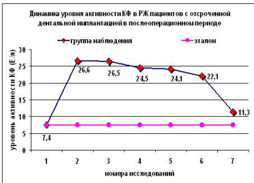
Рисунок 1. Динамика уровня активности КФ в ротовой жидкости пациентов в послеоперационном периоде при выполнении отсроченной дентальной имплантации, квадраты обозначают достоверные различия по отношению к результатам 1-го исследования (до операции) - p < 0,05 - 0,001 .

При 5-ом исследовании (21 сутки) констатируется снижение уровня активности КФ отмечаемое и в последующих исследованиях, что обусловлено процессами постепенного восстановления костной ткани, соответствующими этапам остеоинтеграции. Динамика уровня активности КФ в ротовой жидкости пациентов в послеоперационном периоде при выполнении отсроченной дентальной имплантации приведена на рис. 1.