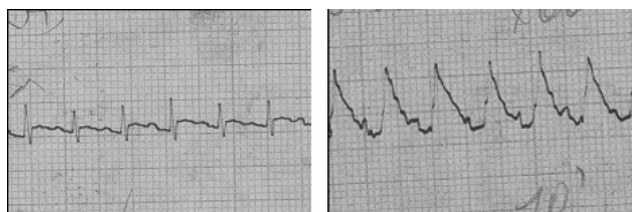
Рисунок 1. Типичные электрокардиограммы, записанные через 15-20 минут после операции: А – у ложнооперированных крыс; Б – у крыс с крупноочаговым инфарктом миокарда.

Критерием отбора животных в эксперимент были типичные изменения на ЭКГ, выявляемые через 15-20 минут после начала эксперимента: подъем интервала S-T или появление монофазной кривой типа R-T (Рис.1). Эти изменения характерны для острого ишемического повреждения сердца и соответствует крупноочаговому инфаркту миокарда у человека. Необходимо отметить, что: 1) масса животных, включенных в эксперимент, была сопоставима во всех группах, так же как и масса выделенного левого желудочка; 2) у ложнооперированных животных (группа 0) изменений на электрокардиограмме не наблюдалось; 3) под влиянием ГБО у части животных через 24 часа отмечалась восстановление нормальной ЭКГ (Табл.1). Так, «инфарктные» изменения ЭКГ имели место у всех крыс 1-й группы, а также у крыс, у которых применяли ГБО при давлении кислорода 0,1 МПа (группы 4 и 5), а у животных 3-й группы в 1/3 случаев наступила нормализация ЭКГ.