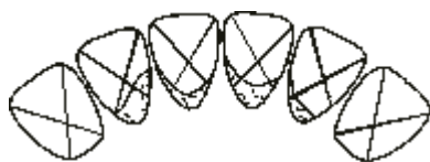
Рис.4. Индекс зубного камня (CSI) (Calculus Surface Index)