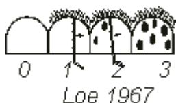
Рис.8. Десневой индекс (GI)