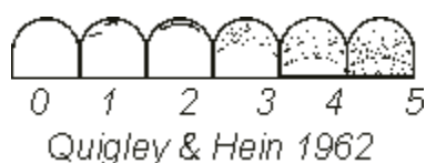
Рис.6. Индекс зубного налета

Сравнивая эффективность удаления зубного налета с помощью электрической и обычной зубной щетки, Quigley и Hein (1962) посчитали критерии ОНІ не достаточно чувствительными для того, чтобы дифференцировать небольшие изменения в количестве зубного налета. Поэтому они добавили 2 критерия между кодами 0 и 1 в системе ОНІ (рис.6)[11].