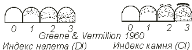
Рис.3. Индекс гигиены полости рта (ОHI) Грина-Вермиллиона

Предложенные критерии ОHI были основаны на двух составных частях: количество зубного налета на коронке зуба (индекс налета, DI) и протяженность наддесневого зубного камня и (или) наличие поддесневого зубного камня на поверхности зуба (индекс камня, CI).