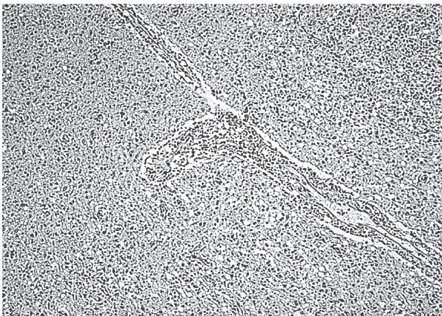
Рис.2. Рабический менингоэнцефалит: лимфоцитарная инфильтрация вирхов-робеновских пространств, многочисленные микроглиальные узелки. Окраска гематоксилином и эозином. Ув.63.