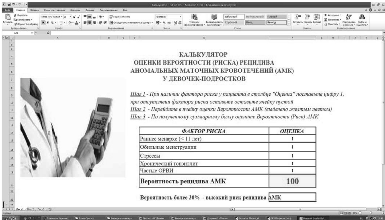
Рисунок 1. Пример калькулятора риска рецидива АМК у девочек-подростков, созданного в Microsoft Excel на основании уравнения бинарной логистической регрессии

ности (риска) рецидива АМК необходимо отметить цифрой 1 каждый из имеющихся у пациента факторов риска, а затем перейти в ячейку «Вероятность рецидива АМК» для просмотра и оценки результата.