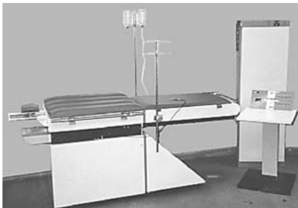
Рис.1 Установка для создания общей гипертермии (Яхта-5).

У одного больного была рецидивная злокачественная мезенхимальная саркома правой доли печени. Больному проводится противорецидивная химиотерапия в условиях ОГ.