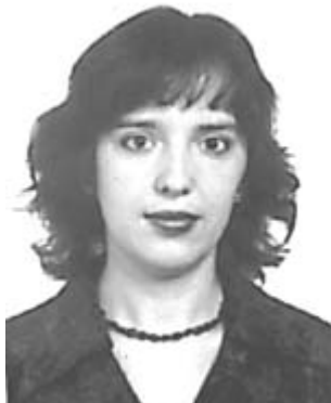
Ю.А.Кубарко Минский консультативно диагностический центр

В статье приведены данные количественной оценки показателей разных типов саккадических движений глаз и визуально ведомых моторных реакций здоровых людей: латентности, длительности, фиксации, слитности движений. Обсуждаются центральные и периферические механизмы контроля саккадических движений глаз. Ключевые слова: саккады глаз, моторные реакции, механизмы регуляции.