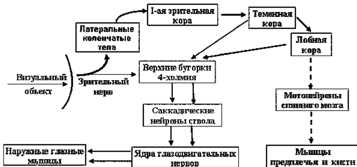
Рис.2. Схематическое представление нейронных путей организации глазных саккад и визуально ведомых моторных реакций. Тонкими сплошными линиями представлены пути рефлекторных саккад; толстыми сплошными – произвольных саккад; пунктирными – моторных реакций мышц предплечья и кисти. Другие пояснения приведены в тексте.

Таким образом, основные различия ЛП визуальных и слуховых рефлекторных или произвольных саккад могут быть объяснены различными временными затратами на обработку, анализ афферентных сигналов и формирование моторных программ запуска саккадических движений глаз. Так, из различий длительности ЛП дифференцированных и недифференцированных слуховых саккад следует, что мозг здоровых молодых людей на осуществление этой операции тратит около 40 мс. Затраты мозгом времени на подобные операции закономерно возрастут при усложнении двигательных задач и, например, для осуществления сложных последовательных саккад в тесте антисаккада+саккада, составили около 50 мс.