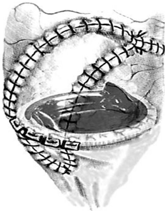
Рис. 3. Схематическое изображение завершенной реконструкции корня аорты и протезирования аортального клапана.

Результаты. Средний диаметр аортального кольца, измеренного во время операции в основной группе, составил 20,8 \pm 1,2 мм (19-23). Расширение аортального кольца заплатой позволило имплантировать протезы на 1 - 3 размера больше, чем было определено измерителем, и избежать развития синдрома несоответствия "пациент-протез". В основной группе удалось имплантировать аортальные протезы диаметром 21 мм – 3 клапана, 23 мм - 23 протеза и 25 мм- 14.