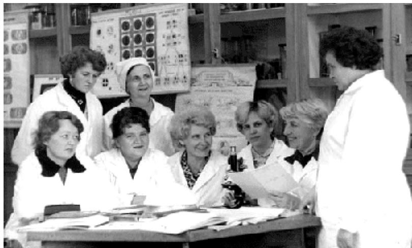
Коллектив кафедры биологии, 1977 год. Обсуждение методики проведения практических занятий со студентами.