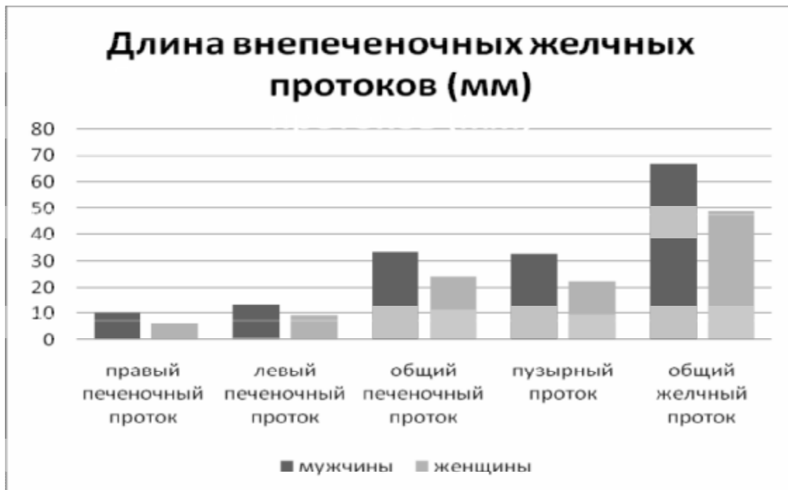
Рисунок 1. Половые особенности длины внепеченочных желчных протоков у человека.