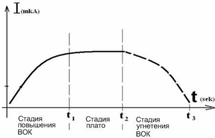
Рис. 1 Стадии рефлекторной кожной симпатической реакции во время проведения ДСД-тестирования (объяснение в тексте).