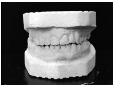
Рис.4. Прикус пациента 3. после проведенного ортопедо-хирургического лечения.