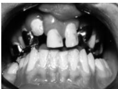
Рис.2. Аппарат для ускоренного верхнечелюстного расширения с окклюзионной накладкой и язычным пелотом зафиксирован в полости рта

Применяли методику ускоренного верхнечелюстного расширения, при которой дистракцию начинали после наложения и фиксации ортодонтического аппарата, аппарат активировали первые 10 дней утром и вечером на одну четверть оборота, а затем 1 раз в день на четверть оборота до достижения необходимого расширения.