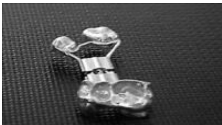
Рис.1. Аппарат для ускоренного верхнечелюстного расширения с окклюзионной накладкой и язычным пелотом.