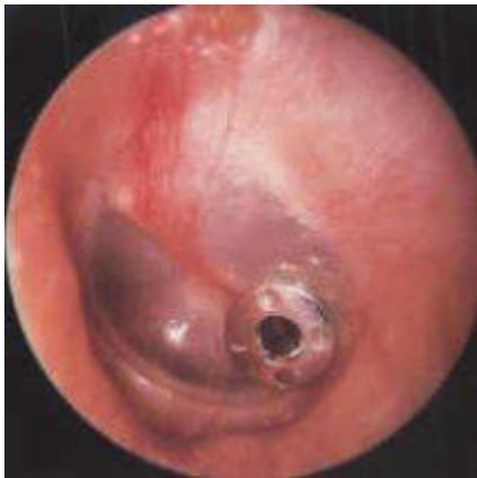
Рис.2. Аппликация шунта в парацентезное отверстие.

Целью нашего исследования явилось изучение состояния буллы кроликов после имплантации целлюлозы и трансплантации ксеноперикарда телят с оценкой возможности использования этих материалов при выполнении мастоидопластики.