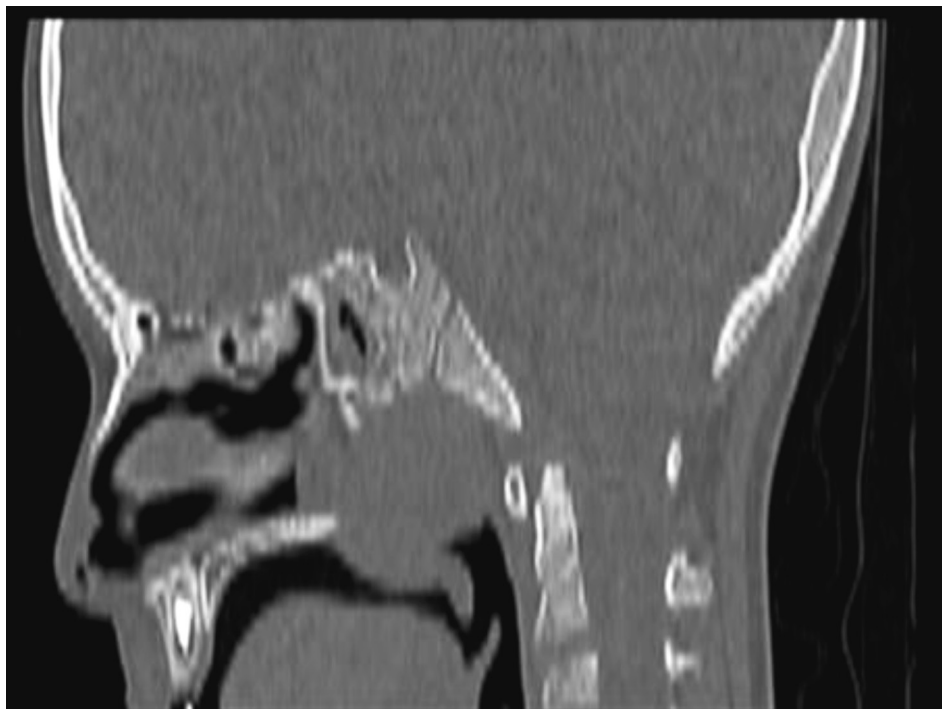
Рисунок 2. КТ лицевого черепа пациента, 22.12.2022 (патологический субстрат полости носа и носоглотке)

3,14×10 12 /л, Ht 25,9 %, ретикулоцитов 7,8 %), в лейкоцитарной формуле палочкоядерных лейкоцитов 7 %, другие показатели в норме. После дообследования к диагнозу добавлено: ОРИ, ринофарингит. Гипертермия. БЭН легкой степени. Анемия легкой степени, скорее всего постгеморрагическая. Дилатация портальной вены (по УЗИ).