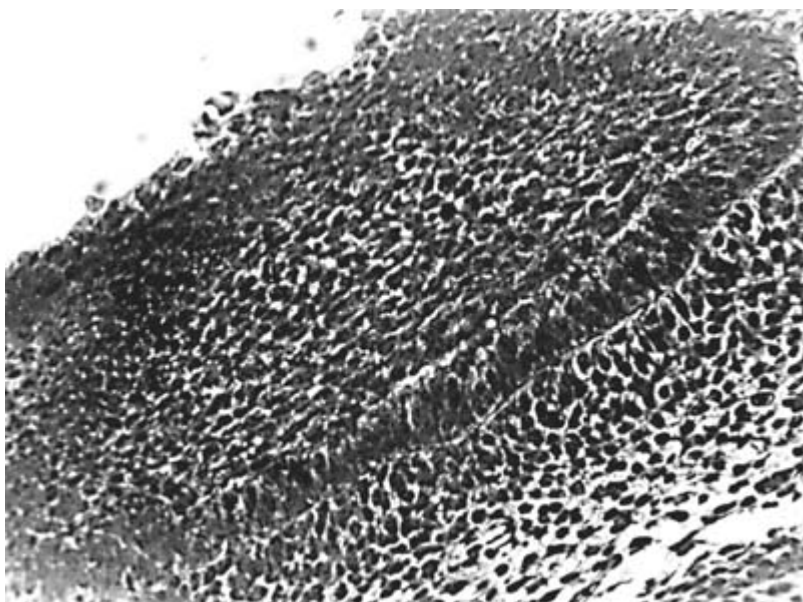
Рис.2 Общий вид эмалевого органа. Четкая дифференцировка внутреннего эмалевого эпителия и основной мембраны. Контроль. Окраска гематоксилином и эозином. Ув. 200.

У контрольных животных призматические клетки внутреннего эмалевого эпителия лежали на хорошо очерченной базальной мембране. Клетки наружного эмалевого эпителия были меньших размеров, гиперхромнее, почти округлые, не образовывали четких слоев (рис.2). Во внутреннем эмалевом эпителии, вдавливаясь в пульпу эмалевого органа, лежали редкие “концентрические структуры” по строению почти неотличимые от таковых в зубной пластинке. По клеточному “конвейеру” эти образования как бы продвигались из зубной пластинки в эмалевый орган, где частично входили в состав наружного и внутреннего эмалевого эпителия, а “избыточные” клетки, наслаиваясь друг на друга, постепенно разрушались. Что подтверждалось наличием кариорексиса с образованием мелких базофильных “обломков” хроматина и отсутствием митозов в “концентрических структурах” (рис.3). Описания таких “концентрических структур” в зубных зачатках 16-суточных плодов крыс в эксперименте мы не встретили.