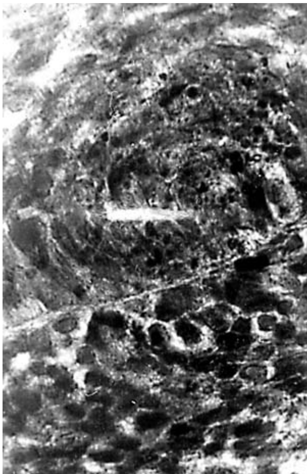
Рис.3. “Концентрическая структура” во внутреннем эмалевом эпителии. Контроль. Окраска гематоксилином и эозином. Ув. 600.

Эмалевый орган в опыте имел меньшие размеры, слабовыраженную шейку, на продольном срезе по форме приближался к неправильной трапеции (рис.4). Площадь его была в 2,79 раза меньше аналогичного показателя в контроле: 1,44 \pm 0,10^* и 4,02 \pm 0,66 мкм 2 ( P < 0,001 ). Эмалевый эпителий нечетко дифференцировался от пульпы. Митотический индекс в клетках внутреннего эмалевого эпителия равнялся 8,91 \pm 2,96\% , в контроле - 20,88 \pm 1,69\% ( P < 0,05 ), снижение в эксперименте в 2,34 раза. Количество клеточных слоев в нем у подопытных крыс оказалось в 1,61 раза меньше, чем у контрольных: 2,30 \pm 0,18 и 3,70 \pm 0,39 ( p < 0,01 ). Толщина внутреннего