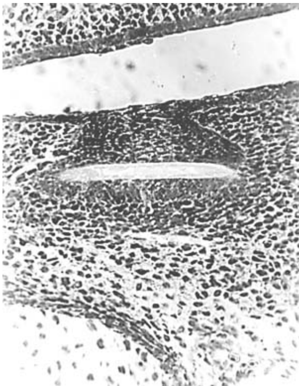
Рис.4 Меньший по размеру эмалевый орган по сравнению с таковым в контроле (ср. с Рис.2). Опыт. Окраска гематоксилином и эозином. Ув. 200.

эмалевого эпителия в опыте и контроле составила соответственно 24,99 \pm 1,51 и 46,17 \pm 3,84 мкм ( P < 0,001 ), разница в 1,85 раза. Толщина наружного эмалевого эпителия была в 1,84 раза меньше у экспериментальных животных по сравнению с контрольными: 25,26 \pm 1,56 и 46,44 \pm 4,80 мкм ( P < 0,001 ).