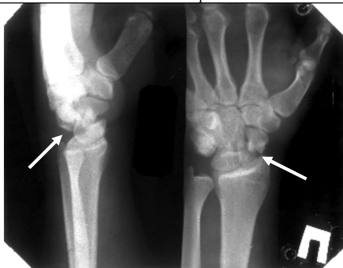
Рисунок 4. Рентгенограмма пациента К; Застарелый чрезладьевидный перилунарный вывих кисти

Переломы некоторых костей запястья со смещением отломков (наиболее часто – ладьевидной кости), остаточная углообразная деформация после сращения перелома дистального отдела лучевой кости на фоне дисторсии связок запястья, аваскулярный некроз костей запястья (чаще – полулунной кости) могут приводить к еще одной форме нестабильности – адаптивному запястью (адаптивному коллапсу запястья) , приводящему к своеобразному «складыванию» рядов запястья под углом друг к другу, снижению запястно-пястного коэффициента и резкому увеличению ладьевидно-полулунного угла (Рис.5. А, Б).