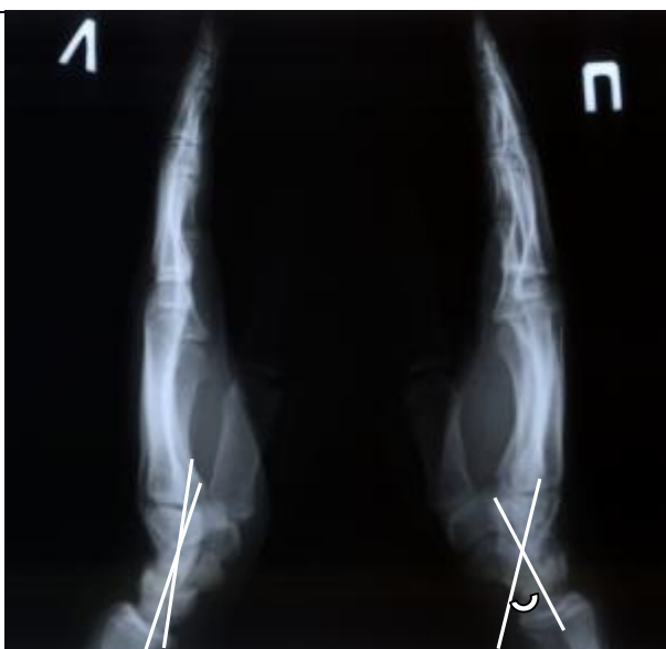
Рисунок 3. Рентгенограмма пациента Я. Увеличение головчато-полулунного угла при недиссоциированной нестабильности запястья справа