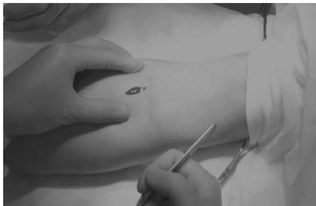
Рисунок 2. Хирургический доступ