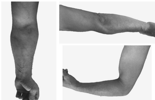
Рисунок 6. Результат через 8 недель

спустя 2 и 5 месяцев. Оценка по DASH 0 баллов. Сроки восстановительного лечения были полностью соблюдены пациентом. Функция конечности полностью восстановилась в 6 недель. Пациент вернулся к активным тренировкам спустя 8 недель (рис. 6).