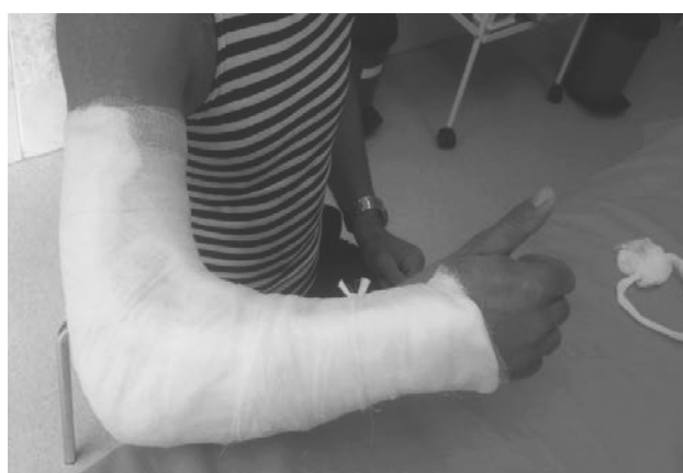
Рисунок 5. Гипсовая иммобилизация после операции

ся до необходимых размеров. При этом не требуется дополнительного рассечения окружающих тканей. На область инсерции по каналу сухожилия бицепса устанавливается направитель под углом в 90° к лучевой кости в сагиттальной плоскости. Поверхность места инсерции обрабатывается вращательными движениями направителя, имеющего на конце рашпильную насечку. При помощи сверла диаметром 3,2 мм выполняется 2 сквозных отверстия в бугристости лучевой кости, расположенных вдоль медиального края. Затем при помощи спиц-проводников нити проводятся через лучевую кость, выводятся на тыл предплечья в проекции, исключающей повреждение лучевого нерва (рис. 4). Для лучшей адаптации узла вдоль спиц расщепляется m. supinator распатором до 1 см. Рука сгибается в локтевом суставе до 90°, нити связываются между собой, и одновременно осуществляется контроль плотности контакта сухожилия и места инсерции. Рана ушивается наглухо и накладывается асептическая повязка. Использование дренажей не требуется.