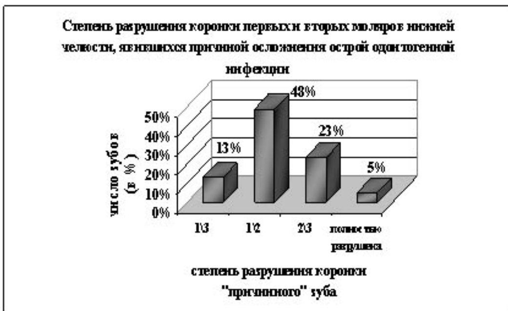
Рис. 2 Степень разрушения коронки первых и вторых моляров нижней челюсти, явившихся причиной осложнения острой одонтогенной инфекции.

Результаты изучения зависимости разрушения твердых тканей зубов с развитием очаговой диффузии острой одонтогенной инфекции по органам и системам свидетельствуют, что осложнения по органам и системам у данной категории больных присутствовало в 100% наблюдений. Распределение частоты отмеченных осложнений по системам органов у пациентов с одонтогенными медиастинитами представлено в табл. 3.