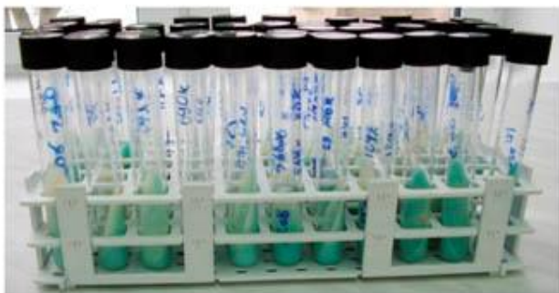
Рисунок 1 - Пробирки со средой Левенштейна-Йенсена

Реагент для обработки мокроты. Свежий реагент для обработки мокроты готовили путем смешивания равных количеств 4% NaOH и 2,9% цитрата натрия. На каждые 100 мл получившегося раствора добавляли 0,5 г порошка N-ацетил-L-цистеина. После добавления N-ацетил-L-цистеина реагент использовали в течение 24 часов.