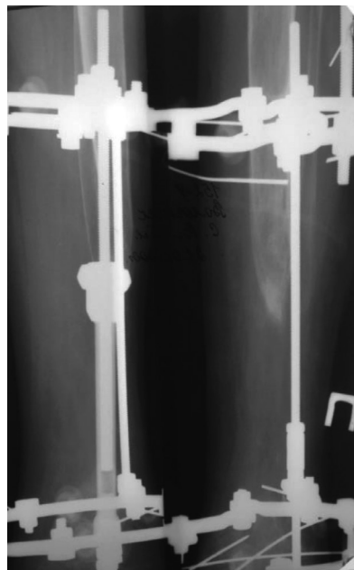
Рисунок 2. Рентгенограмма костей голени в двух проекциях на этапе форсированной дистракции аппаратом Илизарова