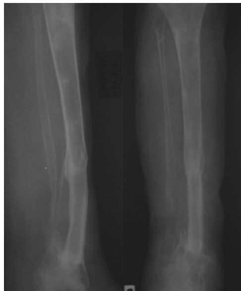
Рисунок 5. Рентгенограмма костей голени через 12 месяцев после аутотрансплантации малоберцовой кости в дефект большеберцовой

2. Двухэтапная поздняя микрохирургическая реконструкции крупных дефектов длинных трубчатых костей с истинным укорочением конечности более 3 см позволяет избежать нейроваскулярных осложнений и контрактур смежных суставов и получить в 90 % случаев хорошие и отличные функциональные результаты лечения.