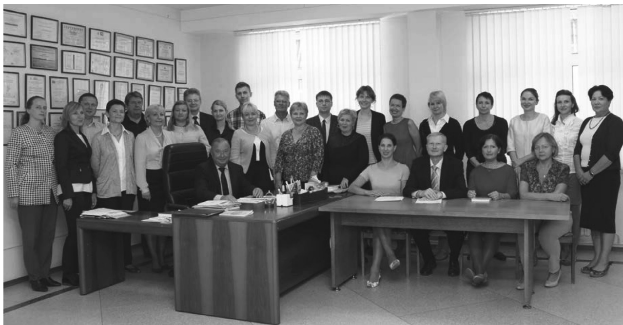
Коллектив 1-й кафедры детских болезней