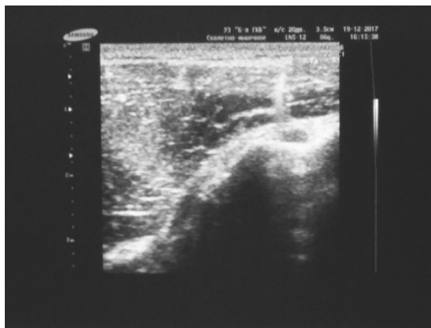
Рисунок 3. Введение препарата гиалуроновой кислоты под ультразвукографическим контролем по ходу бицепитальной борозды

При повреждениях ротаторно-бицепитального комплекса широко использовались подакромияльные новокаиновые блокады с бетаметазоном. Наш опыт показал эффективность введения препаратов гиалуроновой кислоты по ходу бицепитальной борозды под ультразвукографическим контролем. При анализе результатов лечения пациентов как по одной, так и по другой шкале отмечена достоверно более благоприятная ситуация у пациентов группы № 2. Согласно данным современной литературы экзогенный гиалуронат и продукты его биодegradации усиливают синтез протеогликанов, составляющих основу скользящей выстилки перитендона и тем самым улучшают биомеханические свойства сухожилия [5–9]. Введение препарата гиалуроновой кислоты ультразвукографическим контролем по ходу бицепитальной борозды представлено на рисунке 3.