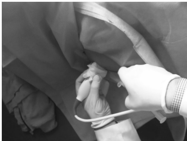
Рисунок 2. Подготовка к введению препарата гиалуроновой кислоты под ультразвукографическим контролем

Курс консервативной терапии в первой группе ( n = 102 ) включал в себя курс лечебной физкультуры, физиотерапевтического лечения, курс подакромияльных новокаиновых блокад с бетаметазоном. Выполнялось 2–3 инъекции с интервалом 1 неделя.