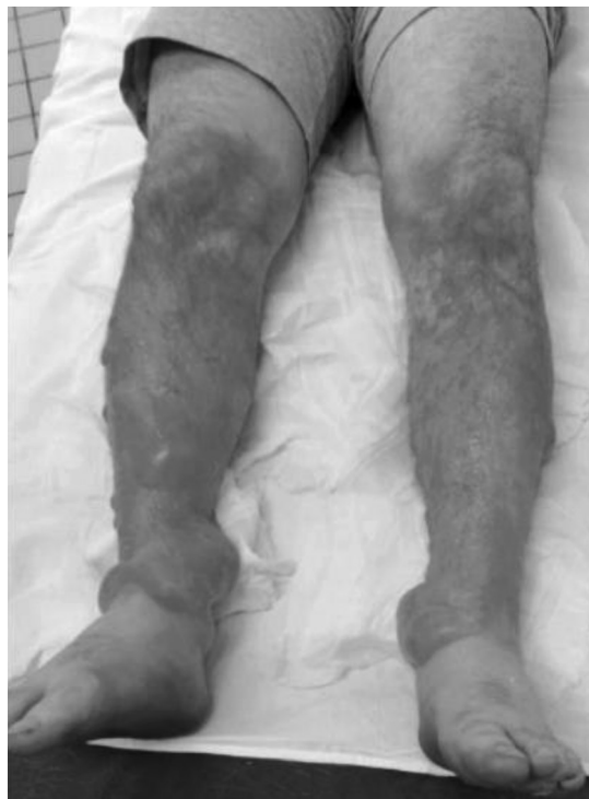
Рис. 1. Клиническая картина фотохимического дерматита, вызванного борщевиком Сосновского [11]

Первые признаки местного поражения кожных покровов появляются не сразу, а через несколько часов и даже несколько суток после контакта с соком растения. Сначала возникает гиперемия кожи с четкими границами, затем появляются мелкие тонкостенные пузырьки, которые впоследствии сливаются в более крупные. Пузырьки напряжённые, толстостенные, наполненные серозным содержимым. При наличии сохранных пузырей болезненность не появляется, однако при нарушении целостности пузыря в месте поражения развивается воспалительная реакция с выраженным болевым синдромом (рис. 1) [11]. В настоящее время не разработаны клинические рекомендации и протоколы